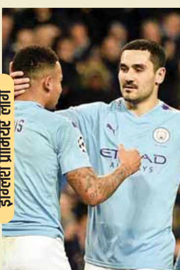
इंग्लिश प्रीमियर लीग