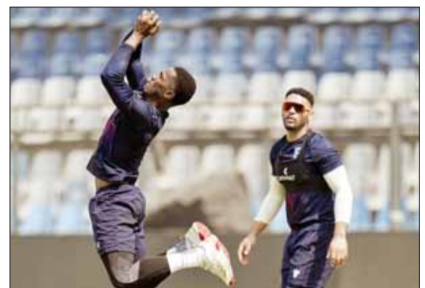
एजेसी ►► मुंबई

टी20 वर्ल्ड कप में सोमवार को जिम्बाब्वे की भिड़त दो बार की चैंपियन वेस्टइंडीज से होगी। दोनों टीमों के बीच होने वाले सुपर-8 राउंड के इस मुकाबले की मेजबानी मुंबई का चानखेड़े स्टेडियम करेगा। जिम्बाब्वे का प्रदर्शन ग्रुप स्टेज में कमाल का रहा था। टीम ने पहले चरण में ही दो बड़े उलटफेर करते हुए सुपर-8 का टिकट कटायी है। जिम्बाब्वे ने पहले दौर में ऑस्ट्रेलिया और श्रीलंका को हराया था।