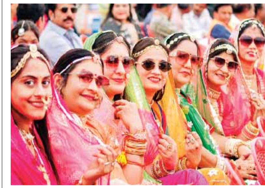
इंदौर। भारतीय भाषा पर्व पर शामिल होने एकत्रित हुई राजस्थान की महिलाएं आकर्षक परिधानों में।