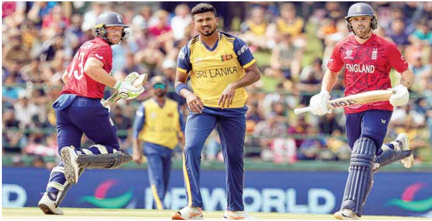
एजेसी ►► पल्लेकेले

इंग्लैंड ने श्रीलंका के खिलाफ रविवार को टी20 वर्ल्ड कप 2026 के सुपर-8 मैच में 51 रन से जीत दर्ज की। यह टी20 अंतरराष्ट्रीय क्रिकेट में श्रीलंका के खिलाफ इंग्लैंड की लगातार 12वीं जीत रही। श्रीलंकाई टीम ने 20 मई 2014 को पिछली बार इंग्लैंड के खिलाफ टी20 मैच जीता था, जिसके बाद से इंग्लैंड ने श्रीलंका को लगातार 12 टी20 मुकाबलों में मात दी है। इस बीच इंग्लैंड ने दो बार 8-8 विकेट से भी मैच अपने नाम किया है। इस जीत के साथ ही इंग्लैंड सुपर-8 के दूसरे ग्रुप में नंबर एक पर पहुंच गई है। 24 फरवरी को इंग्लैंड की अगले मैच में भिड़त पाकिस्तान के साथ होगी।