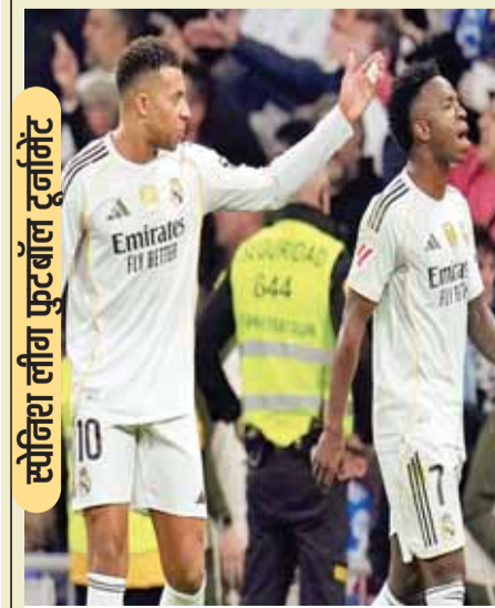
स्पोर्ट्स इलाहाबाद टूर्नामेंट

मैड्रिड। विनिसियस जूनियर ने रियाल मैड्रिड के लिए एक बार फिर गोल किया, लेकिन बाजील का यह खिलाड़ी स्पेनिश लीग फुटबॉल टूर्नामेंट ला लीगा में शीर्ष पर कब्जा अपनी टीम को ओसासुना के हाथों 2-1 की अप्रत्याशित हार से नहीं बचा सका। रियाल मैड्रिड की हार से खिताब जीतने की उसकी उम्मीदों को झटका लगा है। इससे दूसरे स्थान पर कब्जा बार्सिलोना को तालिका में शीर्ष पर पहुंचने का मौका मिल गया है। रियाल मैड्रिड के 25 मैच में 60 अंक जबकि बार्सिलोना के 24 मैच में 58 अंक हैं।