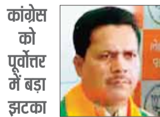
दिसपुर