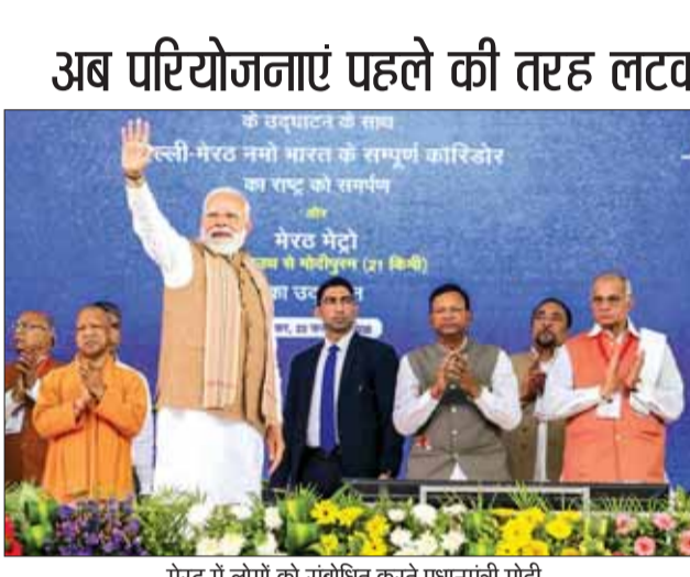
मेरठ में लोगों को संबोधित करते प्रधानमंत्री मोदी