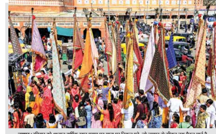
जयपुर। रविवार को श्रद्धालु वार्षिक खाटू श्याम पद यात्रा पर निकल पड़े, जो जयपुर से सीकर तक पैदल मार्च है