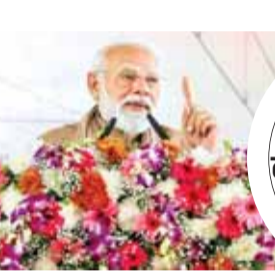
एजेसी नई दिल्ली